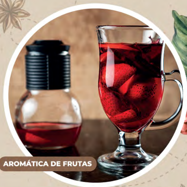
AROMÁTICA DE FRUTAS