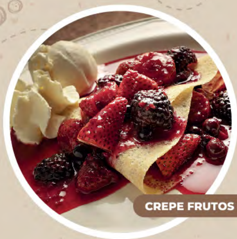
CREPE FRUTOS ROJOS