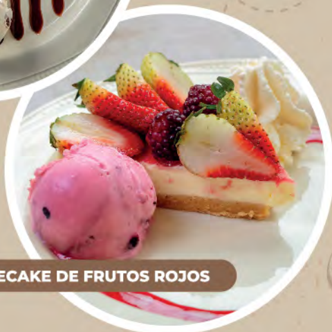
CHEESECAKE DE FRUTOS ROJOS