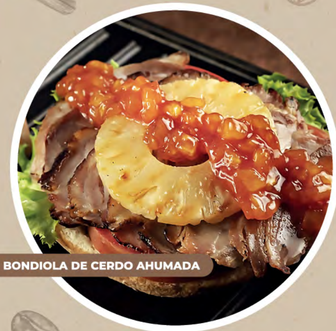
BONDIOLA DE CERDO AHUMADA