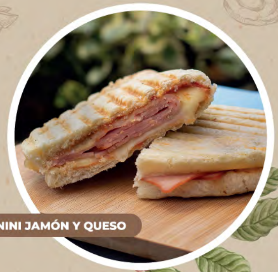
PANINI JAMÓN Y QUESO