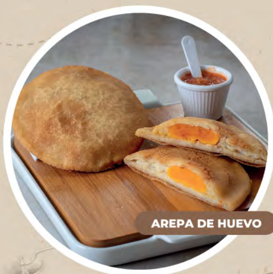
AREPA DE HUEVO