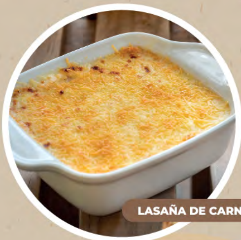
LASAÑA DE CARNE