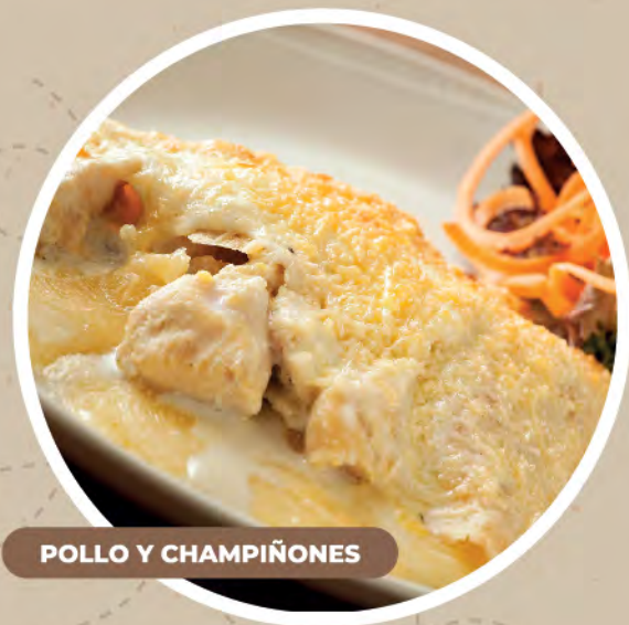
POLLO Y CHAMPIÑONES